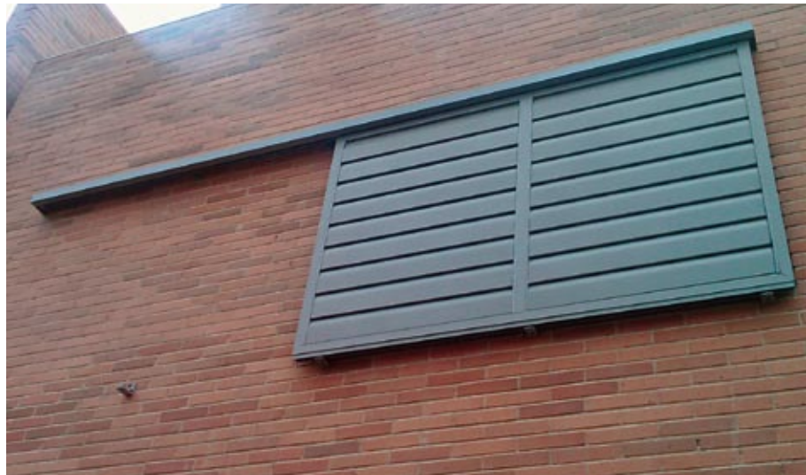
Vivienda unifamiliar con instalación de Celex ® corredera con nuevo tapa guías totalmente integrado con celosía.

Agujeros a 200mm de distancia entre centros.